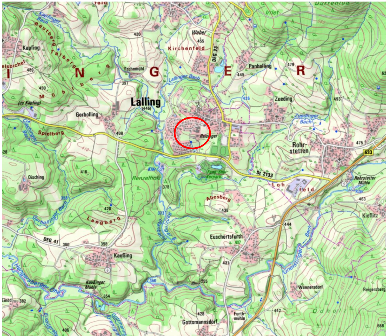
Abb. 1: Übersicht Planungsgebiet (Auszug Bayern-Atlas vom 20.01.2020) – maßstablos

Das Planungsgebiet befindet sich am im Südwesten der Gemeinde Lalling.