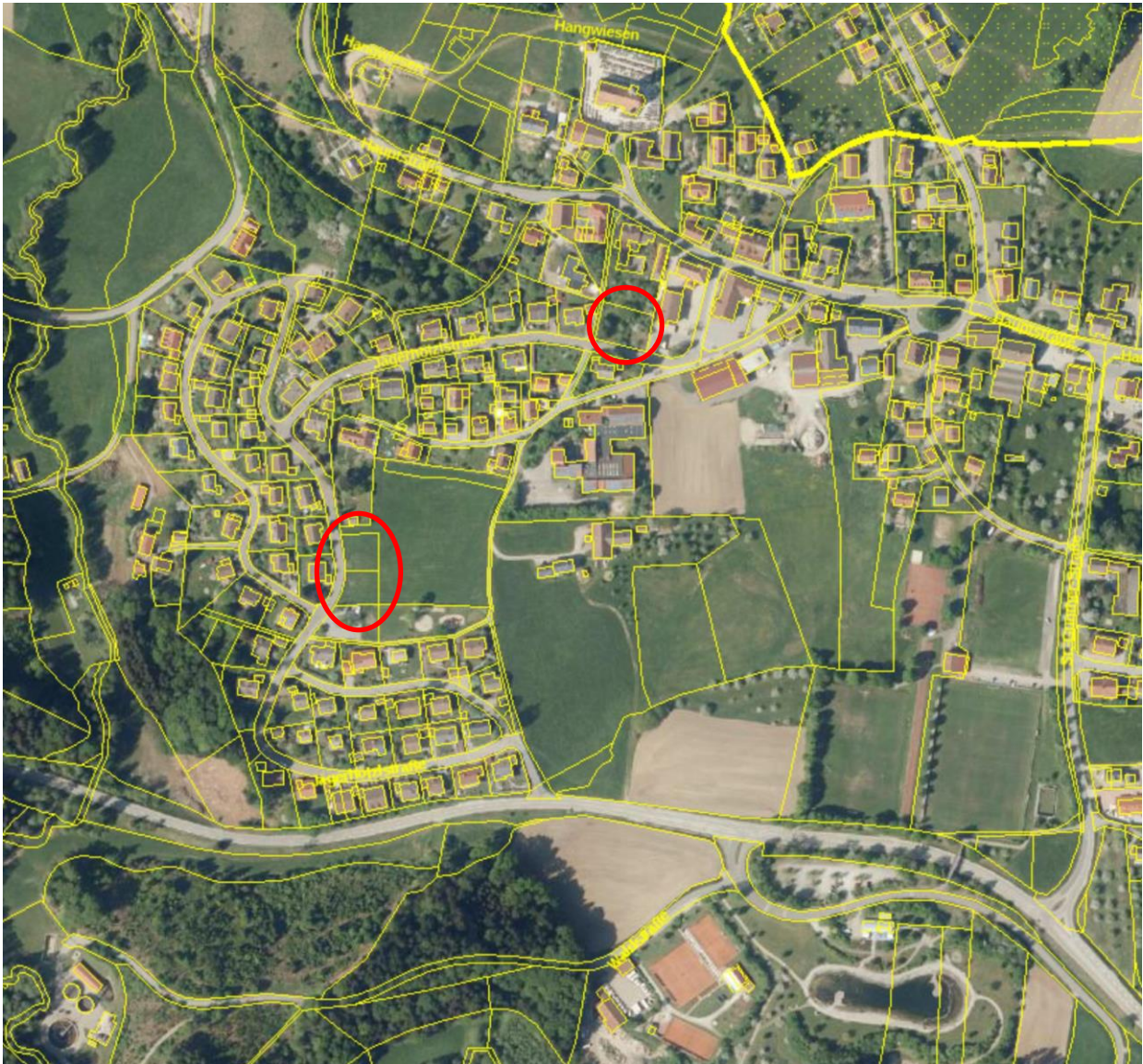
Abb. 2: Luftbildausschnitt aus dem Bayern Atlas vom 20.01.2020 –Maßstab 1:5.000